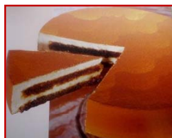
Tarta de Tiramisú