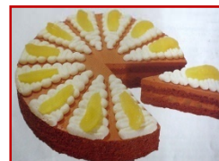
Tarta de Pera y Chocolate con base crujiente de pasta brisa