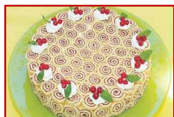
Charlotte de mermelada de frambuesa con bavarois de chocolate