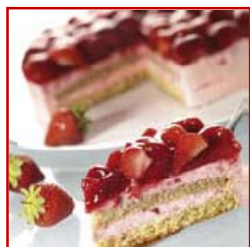
Tarta de fresa con bizcocho de avellana