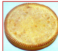
Tarta de Nueces